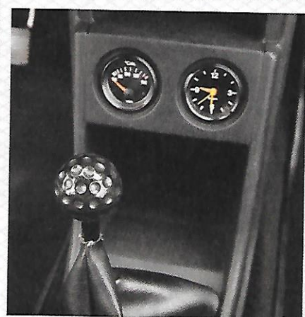
Près du manomètre de température d'huile et de la montre, le célèbre pommeau de levier de vitesses en forme de balle de Golf.