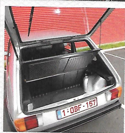
De forme assez régulière et doté d'une ouverture carrée, le coffre est plutôt logeable en dépit des passages de roue. Seul le seuil est un peu haut.